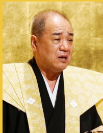
人形浄瑠璃文楽太夫 豊竹呂太夫氏